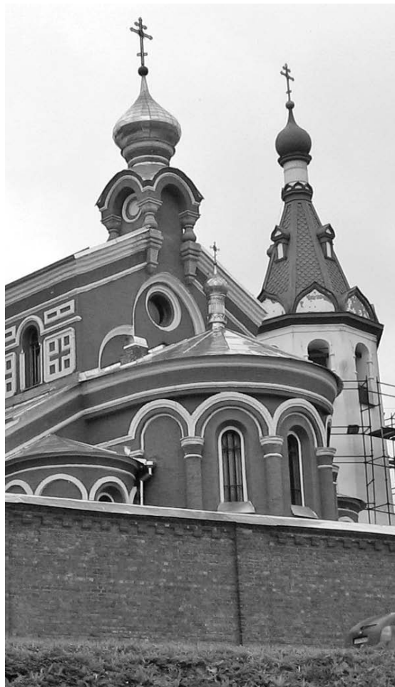
Службы совершаются в Никольском мужском монастыре, храм свт. Иоанна Златоуста