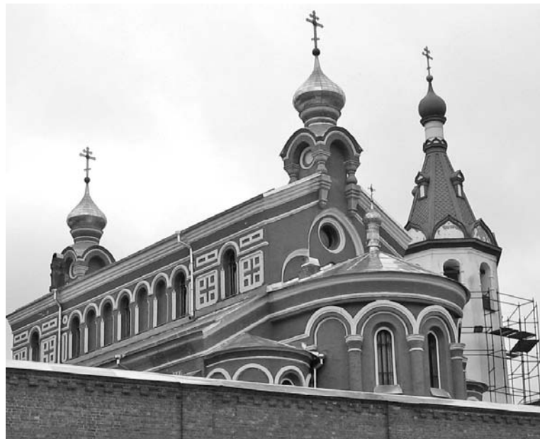
Службы совершаются в соборе Рождества Иоанна Предтечи на Малышевой горе