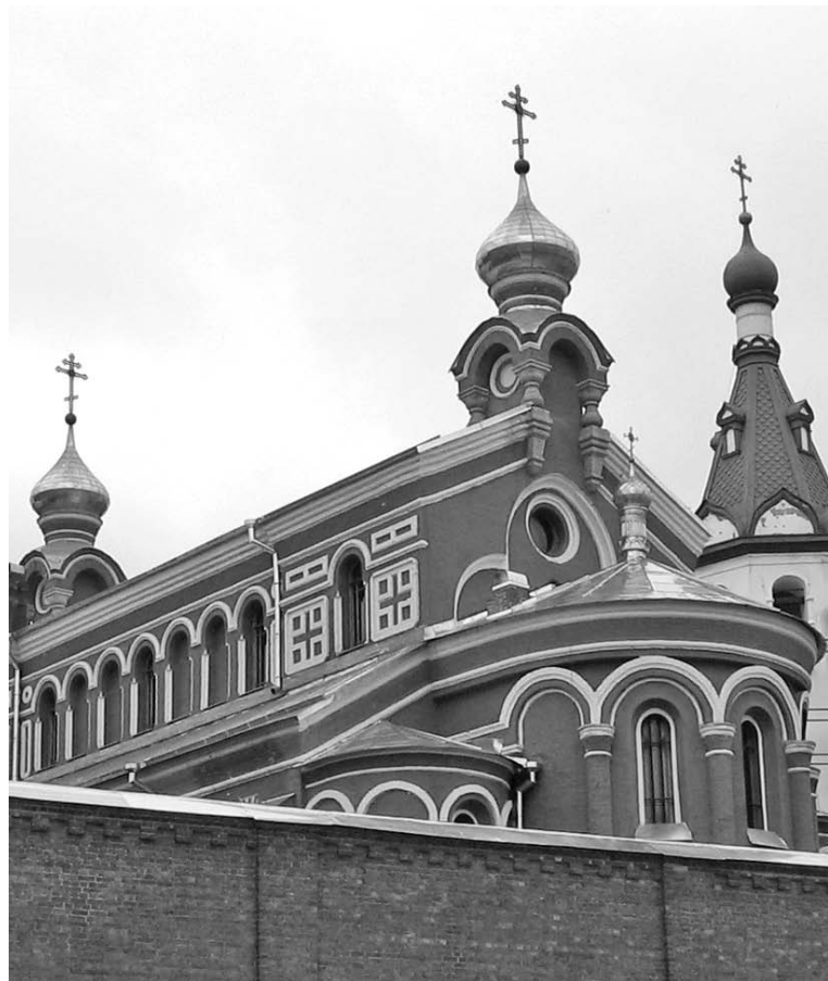
Службы совершаются в Никольском мужском монастыре, храм свт. Иоанна Златоуста

6 сентября, суббота. 17.00. Всенощное бдение. 7 сентября, воскресенье. Неделя 13-я по Пятидесятнице. Перенесение мощей св. ап. Варфоломея. 10.00. Божественная литургия. 8 сентября, понедельник. Сретение Владимирской иконы Пресвятой Богородицы. Мчч. Адриана и Наталии. 10.00. Божественная литургия. 10 сентября, среда. Обретение мощей прп. Иова Почаевского. 10.00. Божественная литургия. 12 сентября, пятница. Прп. Александра Свирского. Перенесение мощей св. блгв. вел. кн. Александра Невского. 10.00. Божественная литургия. 13 сентября, суббота. 17.00. Всенощное бдение. 14 сентября, воскресенье. Неделя 14-я по Пятидесятнице. Черниговской-Гефсиманской иконы Божией Матери. 10.00. Божественная литургия. 20 сентября, суббота. 17.00. Всенощное бдение с литией. 21 сентября, воскресенье. Неделя 15-я по Пятидесятнице. РОЖДЕСТВО Пресвятой Владычицы нашей Богородицы и Приснодевы Марии. 10.00. Божественная литургия. 22 сентября, понедельник. Свт. Феодосия, архиеп. Черниговского. 10.00. Божественная литургия. 26 сентября, пятница. 17.00. Всенощное бдение с литией. Вынос Креста Господня. 27 сентября, суббота. ВОЗДВИЖЕНИЕ Честного и Животворящего Креста Господня. Преставление свт. ИОАННА ЗЛАТОУСТА. 10.00. Божественная литургия. 27 сентября, суббота. 17.00. Всенощное бдение.